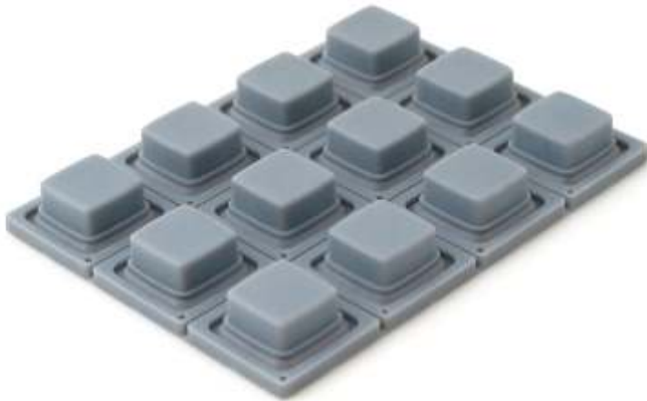
Cinza Claro 05-0623/07-4