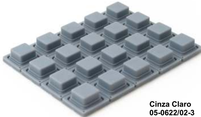
Cinza Claro 05-0622/02-3