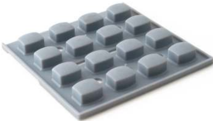
Cinza Claro 05-0625/05-4