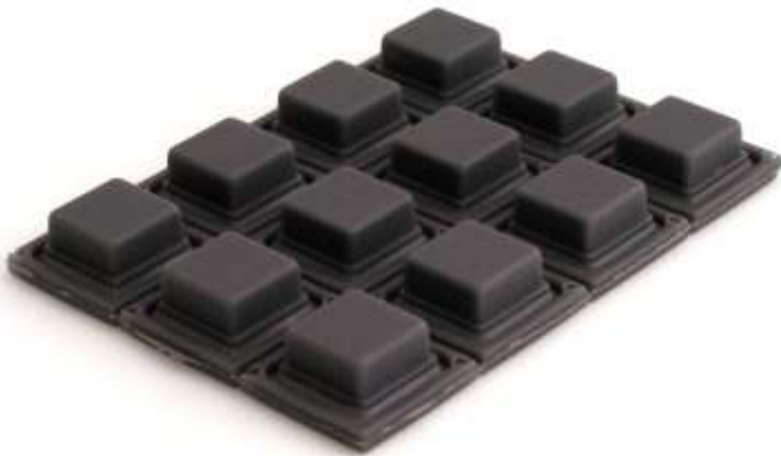
Cinza escuro 05-01XX/YY-Z ou 05-05XX/YY-Z